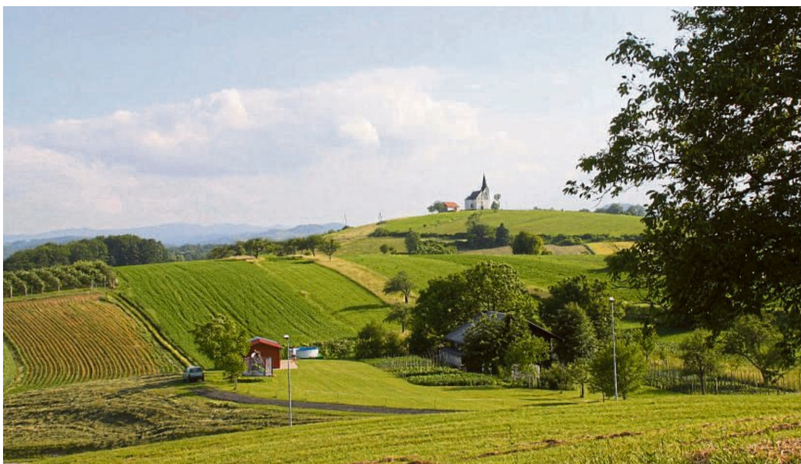
In Šentjur und Umgebung gibt es viele idyllische Ausblicke, die Landschaft lädt nicht nur zum Wandern ein.

Abgesagt wurden das Studenten-Sommerkonzert und die Kulturpartei „Bonjour Šentjur“. Die Jahresausstellung der bildenden Künstler darf aber besucht werden. Für einen Kinder-Kreativ-Workshop und „Märchen unter Baumwipfeln“ im Ipavec Kulturzentrum gibt es Teilnahmebe-