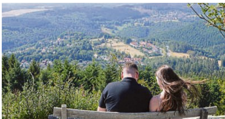
Der höchste Punkt von Schmittten liegt auf 881 Metern, dem Gipfel des Großen Feldbergs. Am Rande des Plateaus hat man vom Brunhildisfelsen einen schönen Blick.

An schönen Tagen mit klarer Luft sind auch der Westerwald und die Wetterau zu sehen. Zu Füßen liegen Nieder- und Oberreifenberg, die Gertrudis-Kapelle und die Burgruine Reifenberg. Einer der ersten, dessen „Besteigung“ des